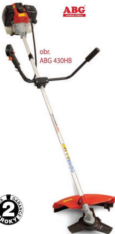
obr. ABG 430HB