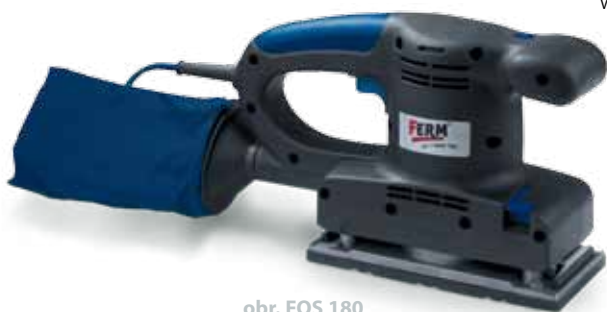
obr. FOS 180