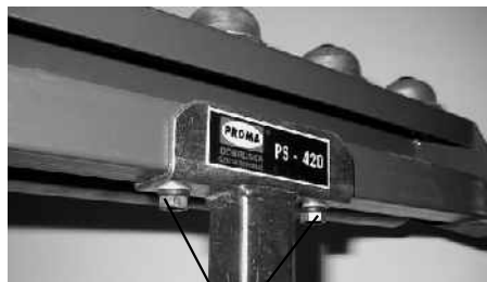
2x šroub M6