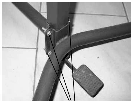
4x šroub M6